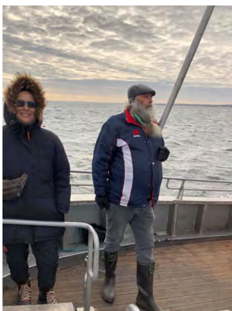
Fisketur på Øresund

I regi af vores grønlænderarbejde arrangerer vi en årlig fisketur. I 2021 havde vi besluttet at brede tilbudet ud, så også de unge og vores ældre fik tilbud om at komme med på fisketuren. Det lykkedes os ikke at lokke nogle unge med i 2021, men to fra ældreklubben tog med på en hyggetur på Øresund, hvor vi fangede masser sild, men desværre ingen torsk.