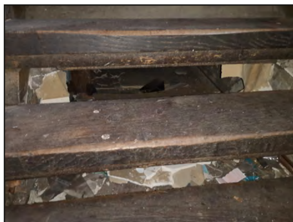
Stash bag bagbeklædning på trapper