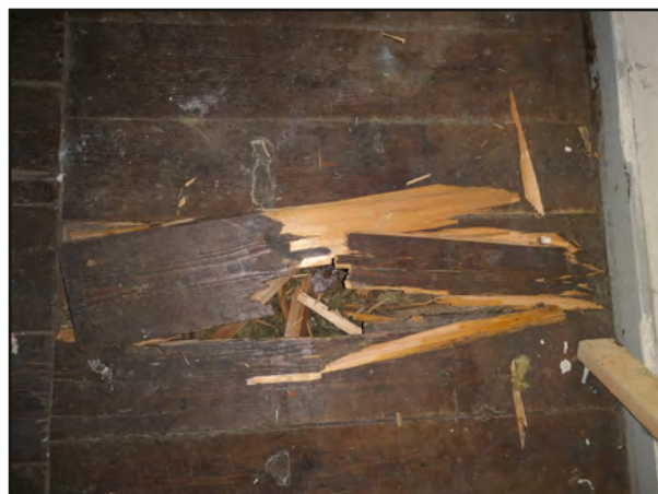
Stash under gulvbrædder