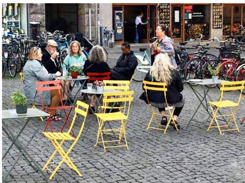
Morgensamling på Christianshavnstovr før udflugt til Helsingør